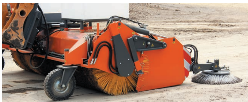
bema Titan Dual monté sur chargeuse sur pneus et doté d'un balai latéral et d'un humidificateur