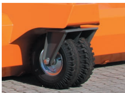
Roues jumelées robustes Ø 460 x 145 mm