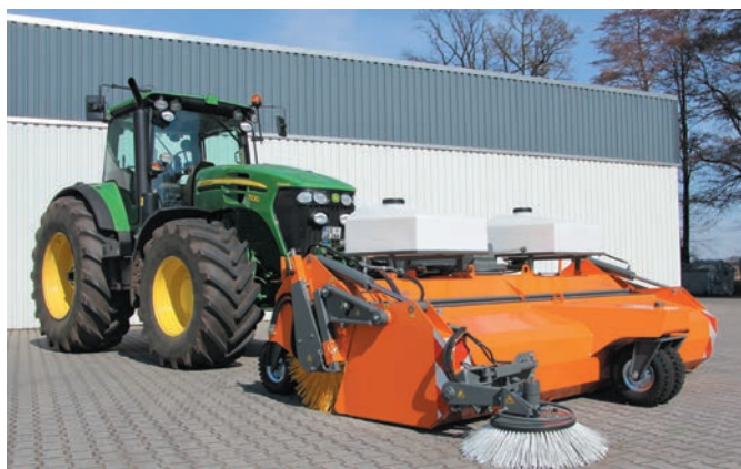
bema Titan Dual monté sur tracteur (attelage frontal)