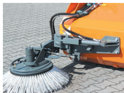
Montage robuste du balai latéral