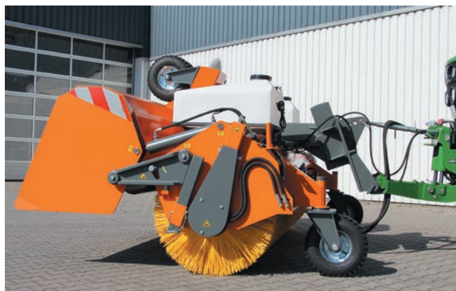
Bac de ramassage ouvert (balayage libre)