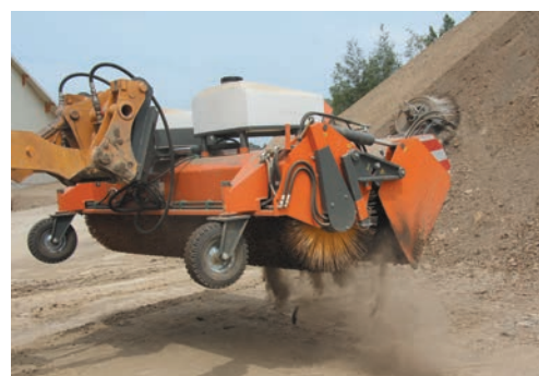
Vidage du bac de ramassage