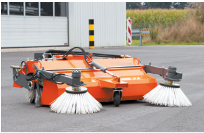
bema Kommunal 450 Dual mit zwei Seitenkehrbesen