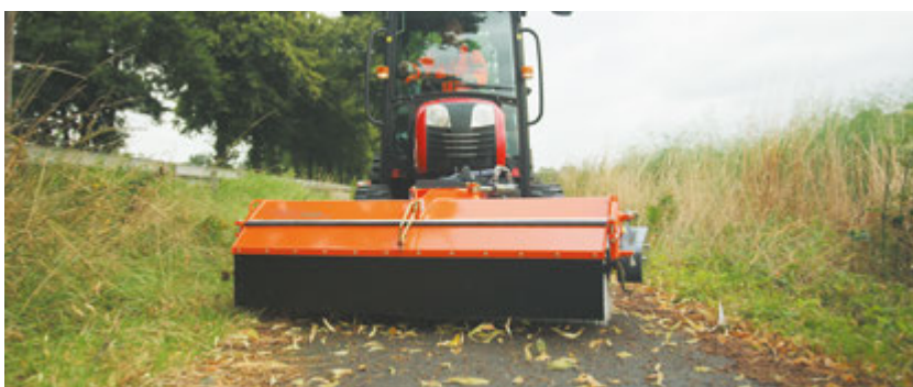
bema Kommunal 450 Dual freikehrend mit Gummispritztuch (ohne Schmutzsammelwanne)