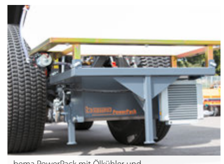
bema PowerPack mit Ölkühler und Wassertank im Heck