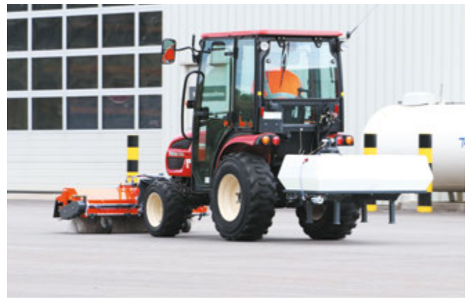
bema Kommunal 450 Dual mit Wassertank im Heck