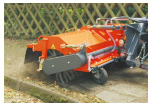
bema Kommunal 450 Dual mit bema Wildkrautbürste