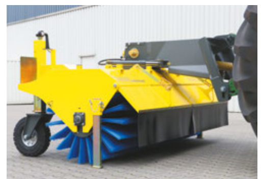
bema Jumbo Airport, Sonderlackierung