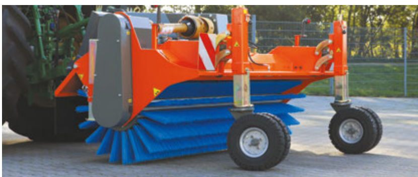
bema Jumbo Airport im Schlepper-Heck, Sonderbau mit hydraulischer Stützradverstellung