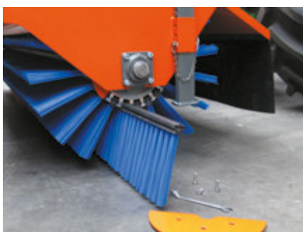
Einfacher Austausch der Bürstenelemente