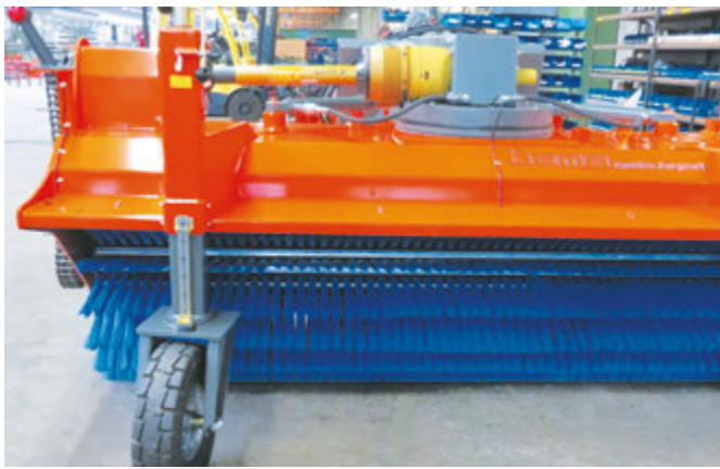
bema Jumbo Airport - stufenlos höhenverstellbare Laufräder