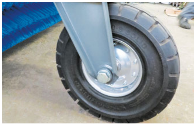
Stabile Super-Elastik-Vollgummiräder Ø 446 x 122 mm mit verstärkter Felge (4 mm)