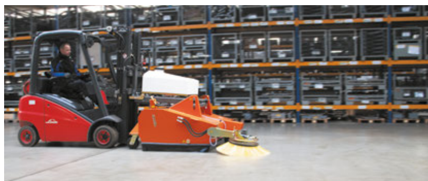
bema 40 Industry überzeugt im Inneneinsatz