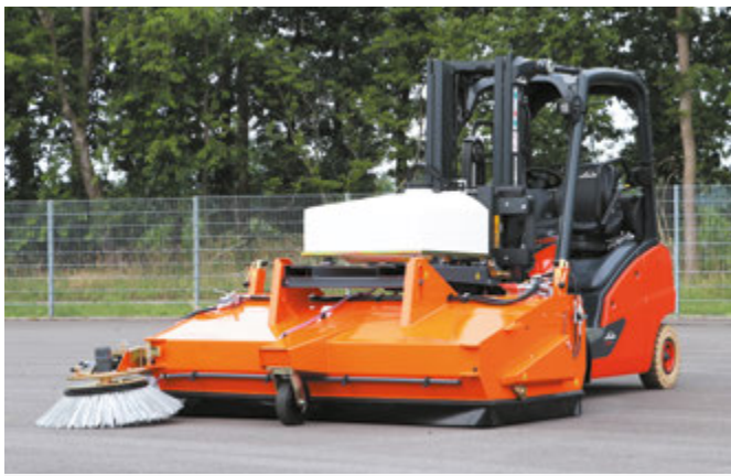
bema 40 Industry mit Seitenkehrbesen und Wassersprüheinrichtung