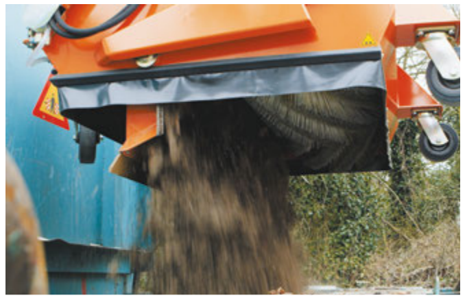
Komfortable Hochentleerung über Container