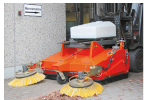
Außenreinigung mit der bema 40 Industry