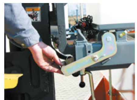
Verriegelung der Aufnahme am Gabelstapler