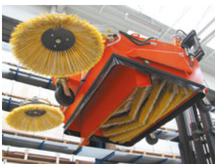
PPN-Industrie-Segmentbesatz, V-förmig angeordnet