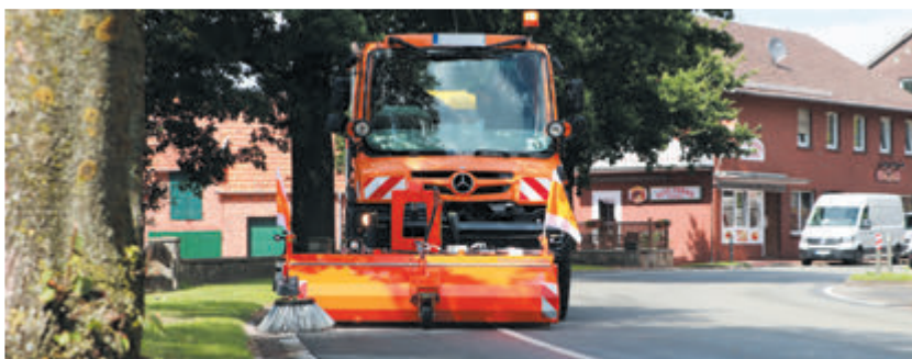
bema 30 Dual PowerMaster am Unimog mit Seitenkehrbesen und hydraulische Seitenverschiebung (rechts/links je 500 mm)