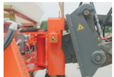
3D-Ausgleich und optionales Drehgelenk