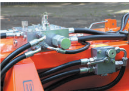
Premium-Hydroblock (optional) und bema SideControl