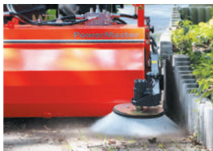
Seitenkehrbesen für Rinnsteine, Bordsteine und Gebäudeangrenzungen