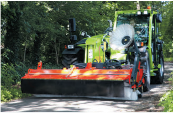
bema 30 Dual PowerMaster ohne Schmutzsammelwanne (Freikehren)