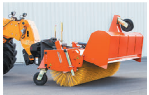
bema 30 Dual PowerMaster am Radlader, Schmutzsammelwanne Dual geöffnet