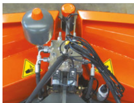
Komfort-Steuerung mit Überlastsicherung