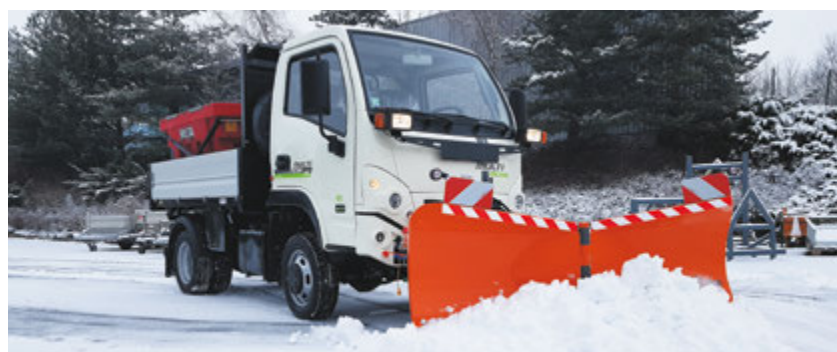
bema V-Schild V800 am Kommunalfahrzeug