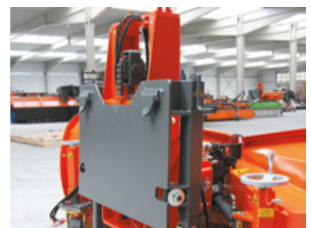
bema Lifter für LKW-Anbau