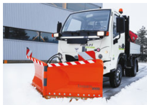
bema V-Schild V800 in V-Stellung