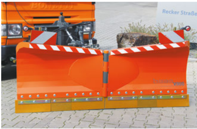
bema V-Schild V800 in gerader Stellung, Schild geschwenkt